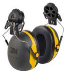
› 3M™ PELTOR™ X2P3