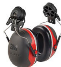
› 3M™ PELTOR™ X3P3