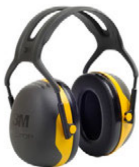
› 3M™ PELTOR™ X2A