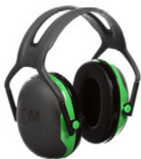
› 3M™ PELTOR™ X1A