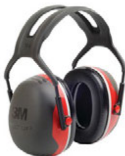
› 3M™ PELTOR™ X3A