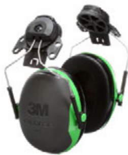
› 3M™ PELTOR™ X1P3

Nauszniki 3M™ PELTOR™ to lekkie ochronniki słuchu z miękkimi, wygodnymi podszkawkami. Są wyposażone w podwójny, izolowany elektrycznie pałąk, który ogranicza nagrzewanie się w okolicach czubka głowy.