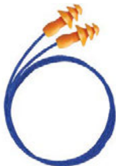
› 3M™ 1271