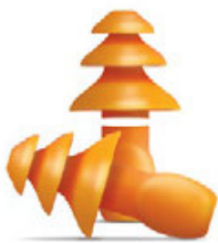
› 3M™ 1261

Wkładki przeciwhałasowe 3M™ serii 1200 wielokrotnego użytku są przeznaczone do umieszczania w przewodzie słuchowym w celu ograniczania narażenia na szkodliwy poziom hałasu do 25 dB.